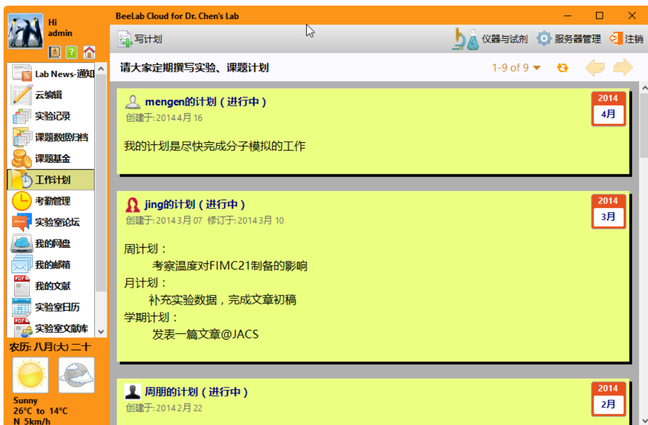
图表 1 工作计划主窗口

如下图所示，实验室成员可以根据老师的要求制定自己的科研计划，提交到这个模块中。各位成员所提交的工作计划将按照提交时间的先后顺序逐条显示在主窗口中。