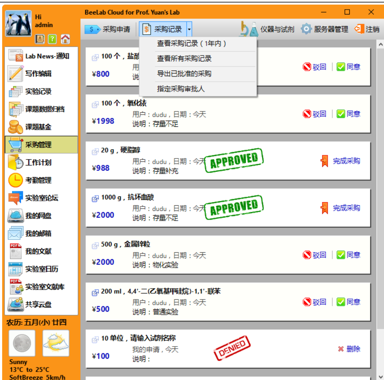
图 3 采购管理模块界面